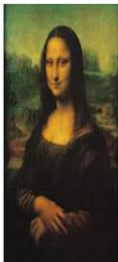
Mona Lisa Leonardo da Vinci

A exposição "Arte em quadrões" é um bom exemplo sobre releitura. O cartunista Maurício de Souza criou releituras de sua Turma da Mônica inspiradas pelas grandes obras da história da Arte. Veja abaixo imagens dessas exposições: