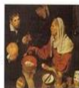
Velha Tritando Ovos, 1998 têxtil sobre tela, 92 x 108 cm National Gallery of Scotland, Edinburgh, Escócia