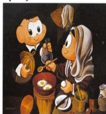
Magali Tritando Ovos Só pra Ela, 1996 acrílica sobre tela, 94 x 114 cm