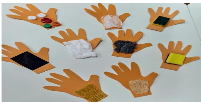
Imagem das mãos sensoriais da sala:

Lembrando que não pode ser: macarrão, Bombril, lixa de fogão, esponja, algodão, arroz, tampa, pois os mesmos já foram usados na sala.