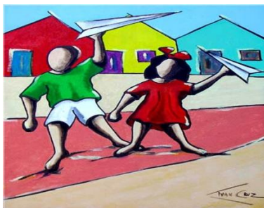
Aviãozinho de papel