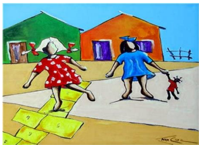
Amarelinha e boneca

Suas telas são de cores fortes e variadas de cerca de 1 metro por 1 metro (1 metro quadrado) em técnica: Acrílico sobre tela, logo chamam a atenção da garotada que se diverte, junto aos adultos que entram em um verdadeiro “túnel do tempo” ao rever suas gostosas brincadeiras.