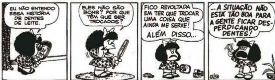
Toda Mafalda. Joaquim Salvador Lavado, (Quino), São Paulo: Martins Fontes. 1993, p.111

3) Ao dizer que “a situação não está tão boa...”, Mafalda revela sua opinião referindo-se: